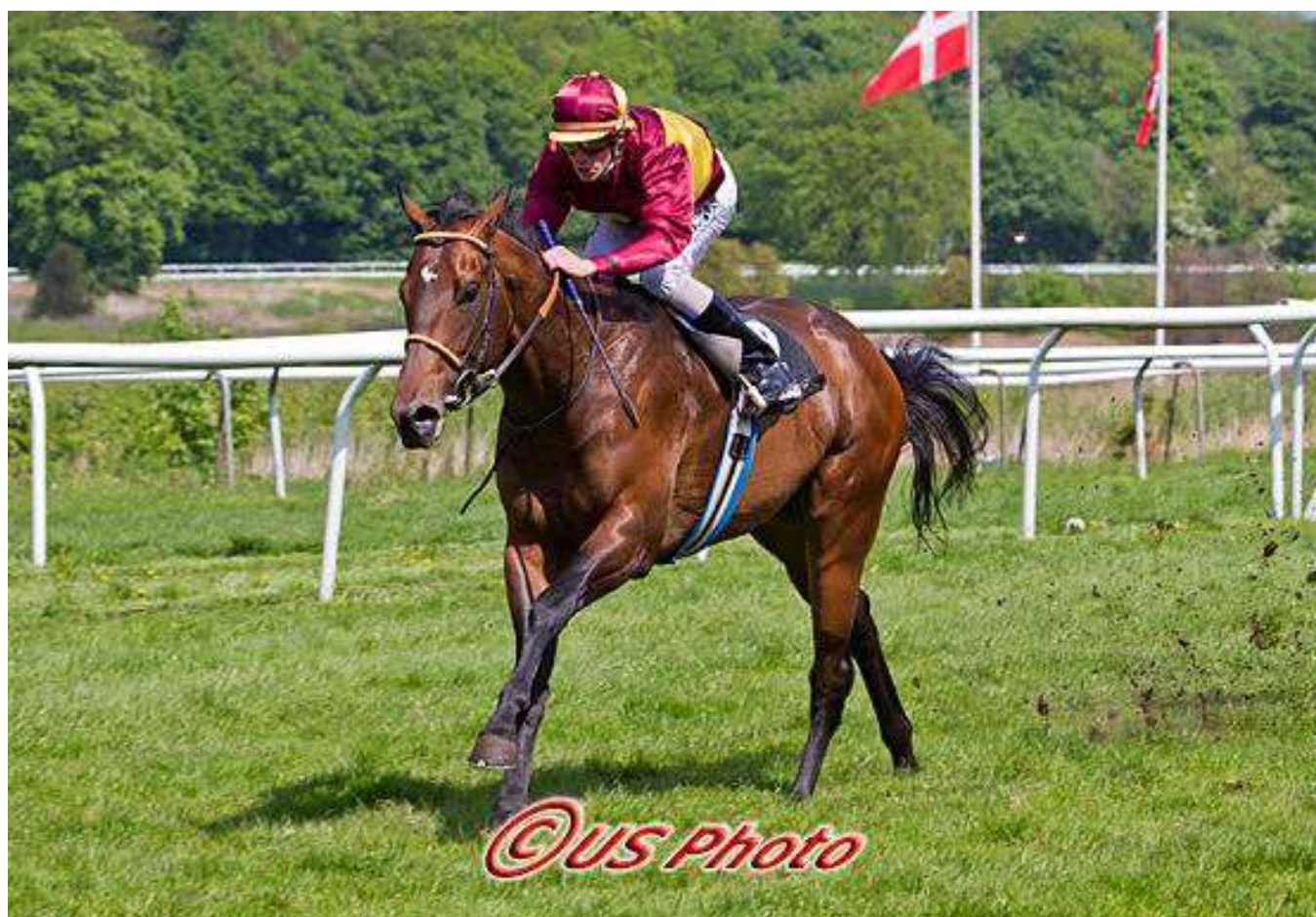
Cantenac (DEN) på vej mod en to længders sejr i Seaside Navigation Dansk 2000 Guineas 2011